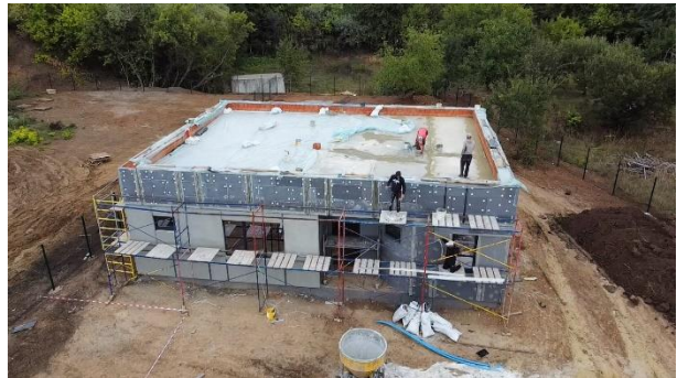
Рис. 1. Ілюстрація зведення експериментального житлового будинку